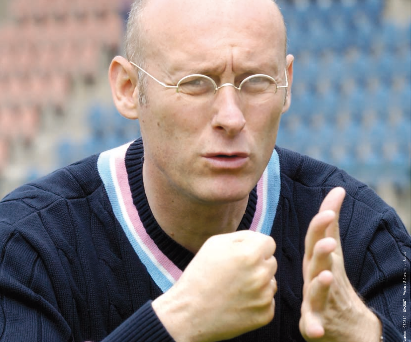
g&a - Nantes - 07/05/19 - 09/2007 - Photo : Stéphane de Sakutin.

“Encourager efficacement le collectif, c’est toute une stratégie.”